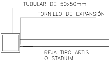
DETALLE DE ENCUENTRO TUBULAR Y PANEL TIPO ARTIS esc 1:5